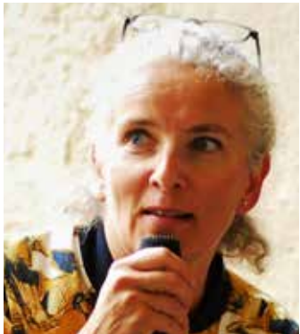
Delphine BATHO députée des Deux-Sèvres, ancienne ministre