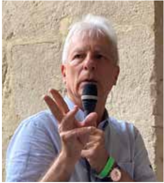
Dominique BOURG philosophe