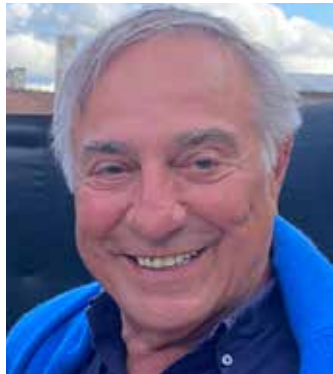
Allain BOUGRAIN- DUBOURG président de la LPO