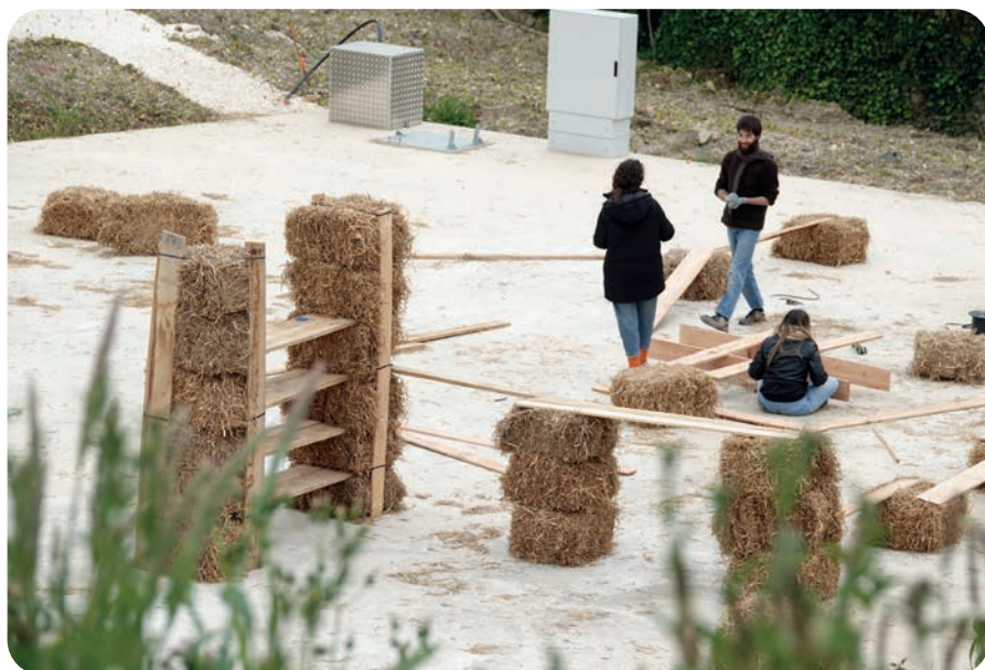
Atelier avec les étudiant·es de l'ENSAD Limoges pour concevoir, à partir des matériaux du territoire, des modules de différentes natures, Promo Ruraux 2023-24