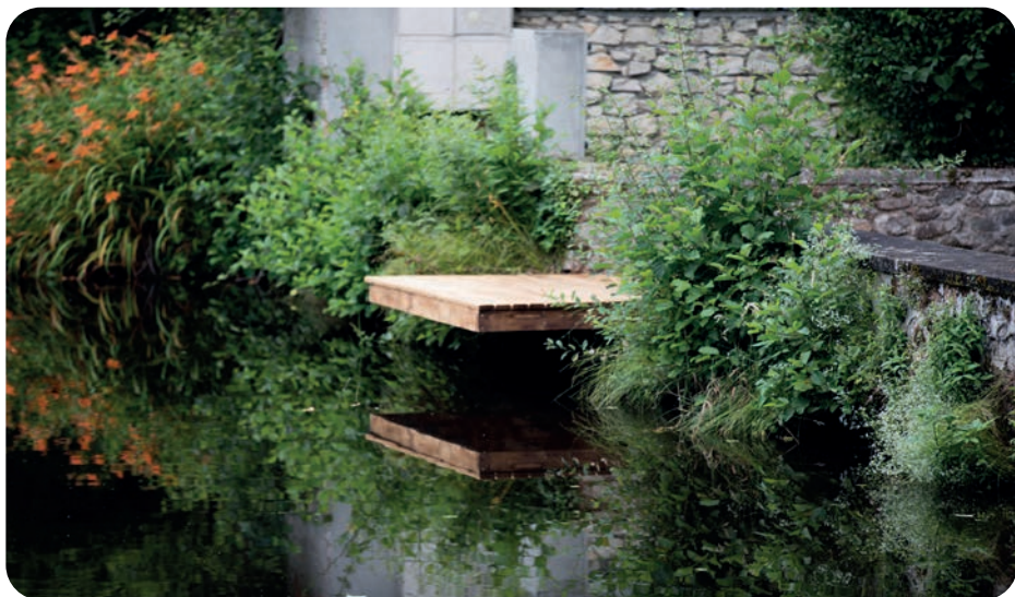
Mobilier rural en châtaignier local pour la ville de Nontron dans le quartier du Faubourg Magnac, Promo Ruraux 2022-23. Julie Eymezy / Rose Schwab

Directeur de l'École des Arts Décoratifs - PSL