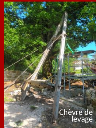
Chèvre de levage