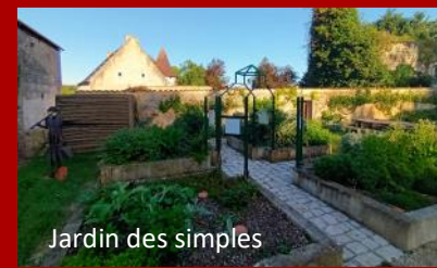
Jardin des simples