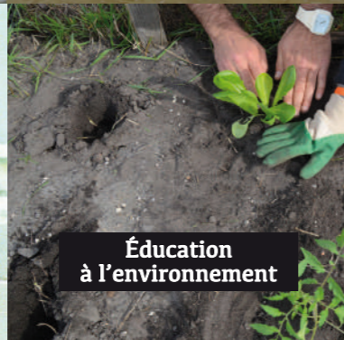
Éducation à l'environnement